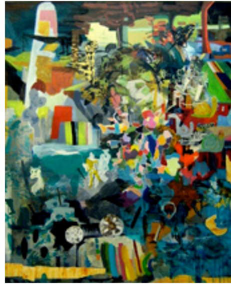
Cemetery 180x160 cm