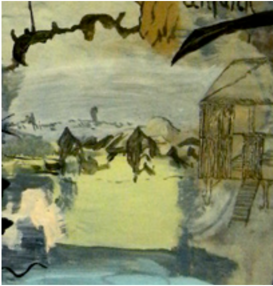
Unfunk (Detail) 120x110 cm