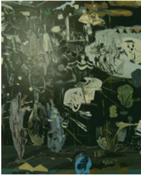
Genealogie 180x160 cm