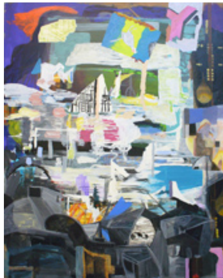
noch zu bauende Stadt 180x160 cm