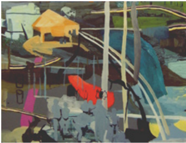
Fosfor 110x80 cm