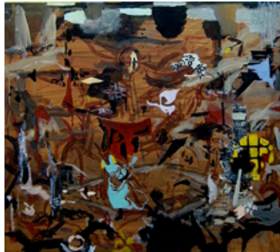
Dulle Griet 110x110 cm