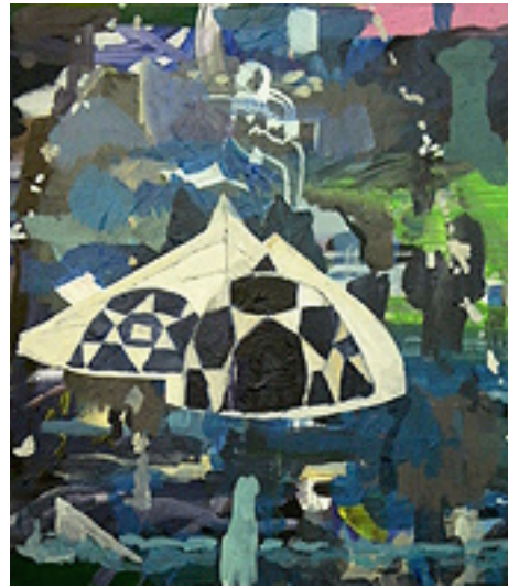
Zelte II 65x60 cm