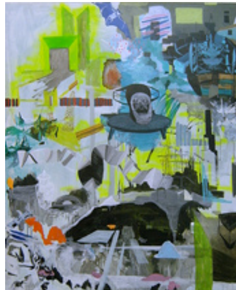
VX_Power 180x160 cm